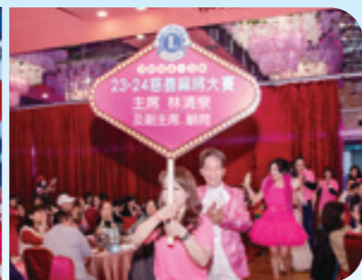
撰文 / 採訪組長 江建宏 攝影 / 攝影組長 傅木從